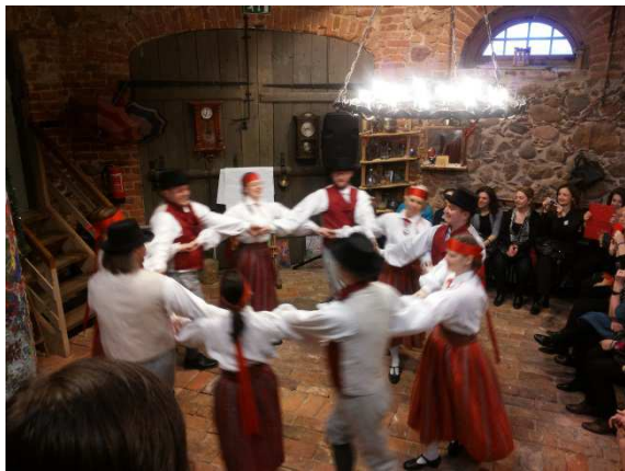
Eesti õhtu Uhti kõrtsis