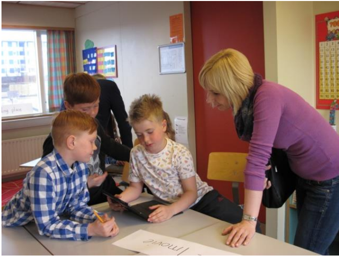
Poisid tutvustavad I-movie kasutamist tundides