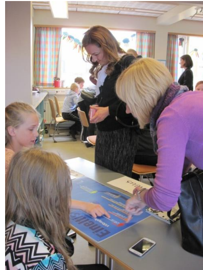
Olwèus`i kiusamise ennetamise meetodid